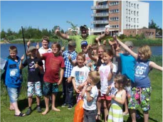
Houten, AUHV jeugddag 2012