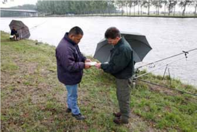
Controle visdocumenten

Het bestuur van de AUHV laat zo vaak als mogelijk controleren door verenigingscontroleurs, BOA's en Politie.